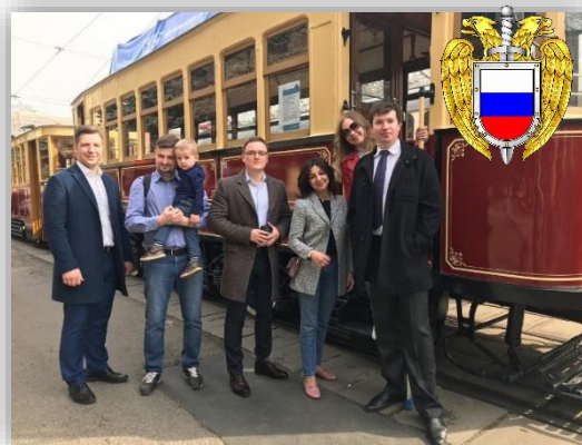
Участие в параде трамваев