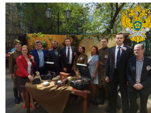
Празднование 9 мая