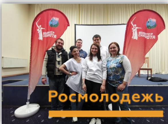
Молодежный образовательный форум «Территория действий»