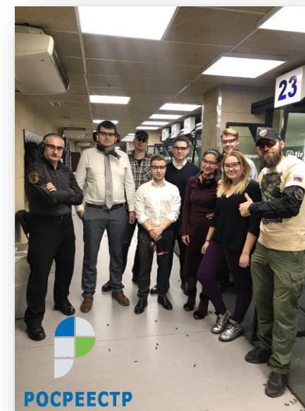
Занятия по стрельбе