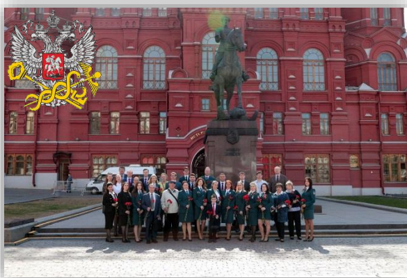
Возложение цветов к могиле неизвестного солдата