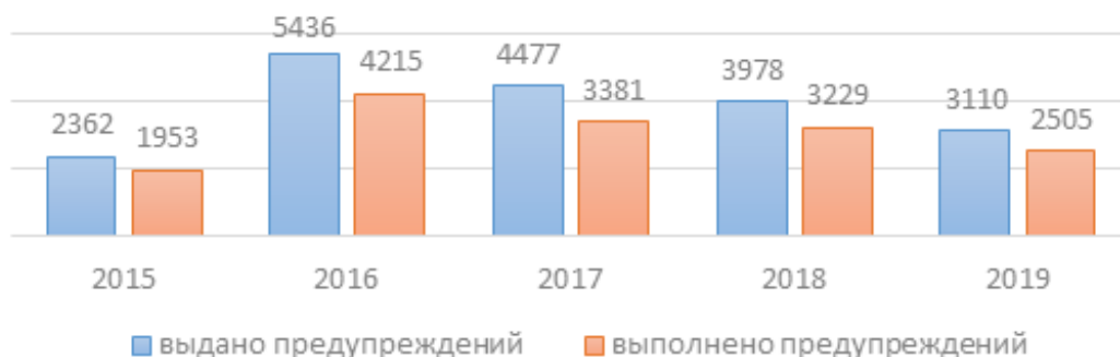
Рис. Количество выданных и исполненных предупреждений

Также уменьшилось число выданных службой предостережений и предупреждений: 103 и 3110 соответственно. 2505 предупреждений исполнены.