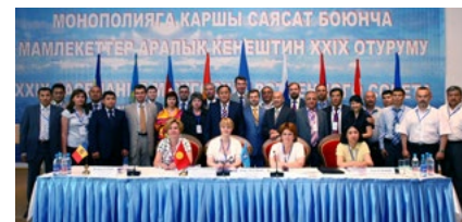
НА ФОТОГРАФИИ УЧАСТНИКИ ЗАСЕДАНИЙ ШТАБА И МСАП, БИШКЕК, 2009 Г.