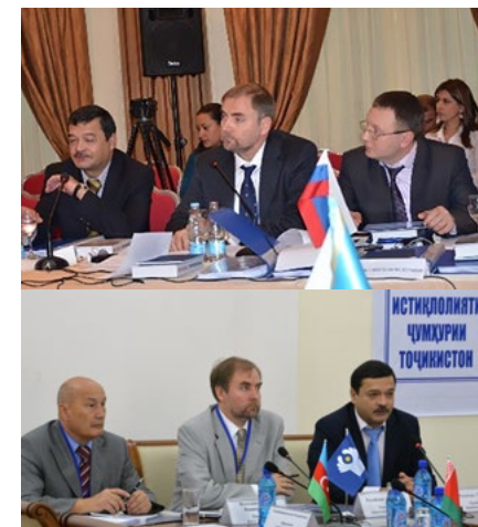
НА ФОТОГРАФИЯХ ЗАСЕДАНИЯ ШТАБА, 2011, 2012 ГГ.

PHOTOS: THE HEADQUARTERS SESSIONS IN 2011 AND 2012