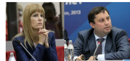
НА ФОТОГРАФИЯХ УЧАСТНИКИ ЗАСЕДАНИЙ МСАП И ШТАБА, ИРКУТСК, 2013 Г.

PHOTOS: PARTICIPANTS OF THE ICAP AND HEADQUARTERS SESSIONS IN IRKUTSK, 2013