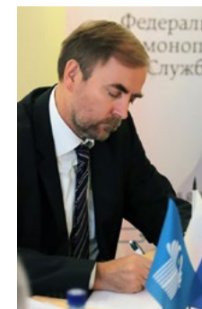
НА ФОТОГРАФИИ ЗАМЕСТИТЕЛЬ РУКОВОДИТЕЛЯ ФАС РОССИИ, РУКОВОДИТЕЛЬ ШТАБА АНАТОЛИЙ ГОЛОМОЛЗИН