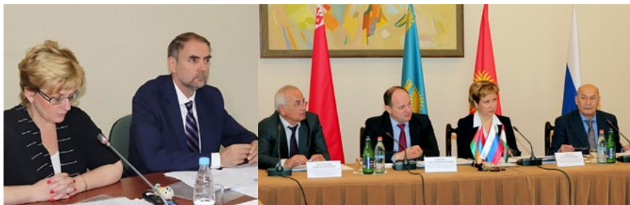
PHOTO: PARTICIPANTS OF THE HEADQUARTERS, MOSCOW, 2015, EREVAN, 2016.

НА ФОТОГРАФИЯХ УЧАСТНИКИ ЗАСЕДАНИЙ ШТАБА, МОСКВА, 2015 Г., ЕРЕВАН, 2016 Г.