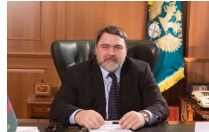
НА ФОТОГРАФИИ РУКОВОДИТЕЛЬ ФАС РОССИИ, ПРЕДСЕДАТЕЛЬ МСАП В ПЕРИОД С ОКТЯБРЯ 2006 Г. ПО ОКТЯБРЬ 2011 Г., С ИЮНЯ 2012 Г. ПО АПРЕЛЬ 2016 ГГ., С АПРЕЛЯ 2016 Г. СОПРЕДСЕДАТЕЛЬ МСАП ИГОРЬ АРТЕМЬЕВ