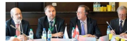
НА ФОТОГРАФИИ СОВМЕСТНОЕ ЗАСЕДАНИЕ ШТАБА И МЕЖДУНАРОДНОЙ РАБОЧЕЙ ГРУППЫ ПО НЕФТИ, КАЗАНЬ, 2012 Г.

PHOTO: A JOINT SESSION OF THE HEADQUARTERS AND OIL WORKING GROUP, KAZAN, 2012