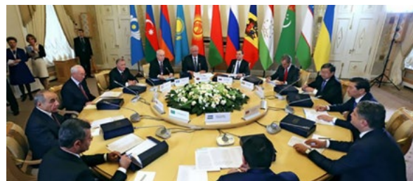
НА ФОТОГРАФИИ: ЗАСЕДАНИЕ СОВЕТА ГЛАВ ПРАВИТЕЛЬСТВ СНГ

The main objects of research are routes connecting capitals and largest cities of the CIS countries. Two types of routes were selected and analyzed: domestic and international (61 routes in total).