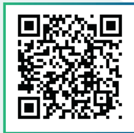
Федеральный закон от 10.07.2023 № 301-ФЗ