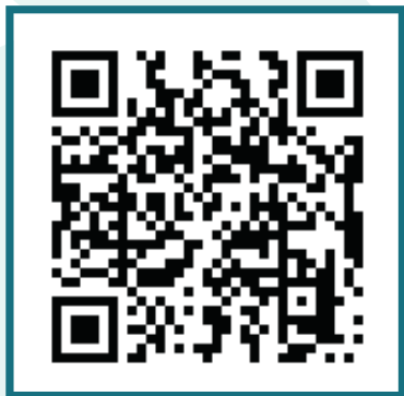
Федеральный закон от 16.02.2022 № 11-ФЗ