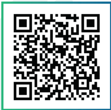
Федеральный закон от 06.03.2022 № 41-ФЗ

*Для тех, кто допустил нарушения по ч. 1-4 ст. 14.32 КоАП РФ в случае, если оплата происходит в течение 20 дней со дня вынесения постановления