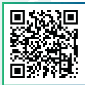
Федеральный закон от 29.12.2022 № 620-ФЗ