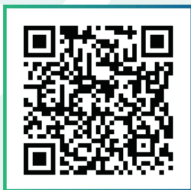
Федеральный закон от 29.12.2022 № 577-ФЗ