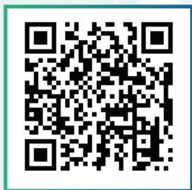
Федеральный закон от 07.10.2022 № 389-ФЗ