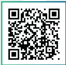
Федеральный закон от 04.08.2023 № 426-ФЗ