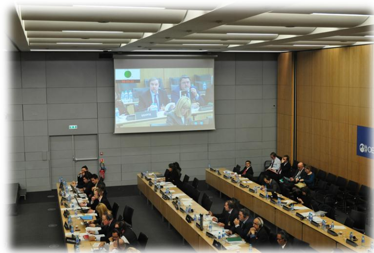
Заседание комитета ОЭСР, февраль 2013, г.Париж

ФАС России и Австрийское федеральное конкурентное ведомство представили совместный доклад о результатах деятельности и инициативах Рабочей группы по нефти