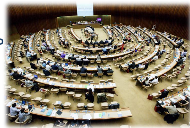
Заседание ЮНКТАД, июль 2013, г.Женева

результаты проведенной работы получили высокую оценку Организации экономического сотрудничества и развития (ОЭСР) и Конференции ООН по торговле и развитию (ЮНКТАД);