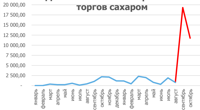
Динамика объема биржевых торгов сахаром

Рекордный дневной объем торгов - 2080 тонн (19.09.2018)