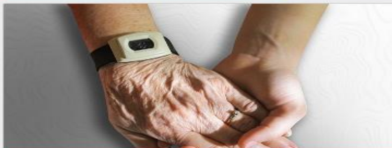
Приемная семья для пожилого человека