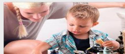
Присмотр за детьми